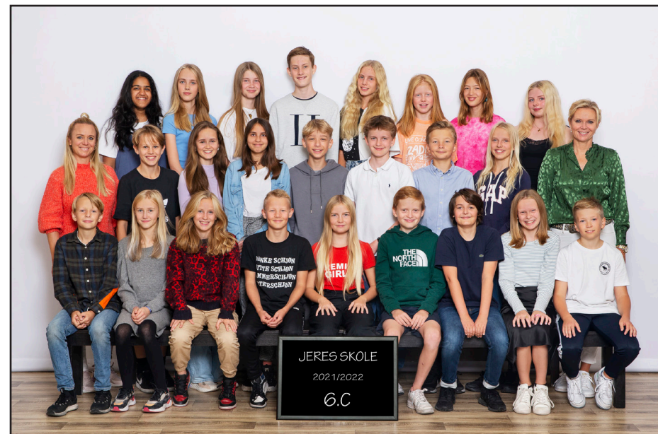
Klassebillede og 9. Klasse fjollebillede

Vi medbringer selv gulv, bænke og baggrund. Dermed undgår vi håndboldstriber på gulvet og ribber i baggrunden. Det skaber et flot og ensartet udtryk. Fjollebillede tager vi også, og det er selvfølgelig indenfor de 30 minutter vi er om at fotografere en klasse. Fjollebilledet har vist sig at være ekstremt populært blandt de 9. klasser og 3.g klasser der får det taget, og de bestiller det allesammen.